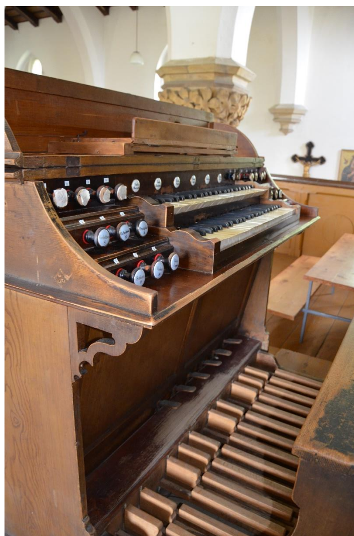
Rapotín, varhany: pohled na hrací stůl.