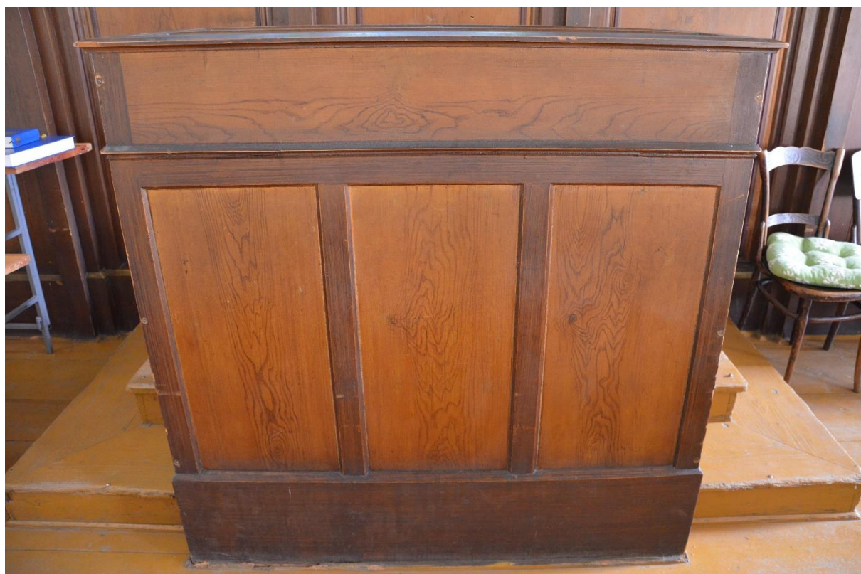
Rapotín, varhany: pohled na hrací stůl.