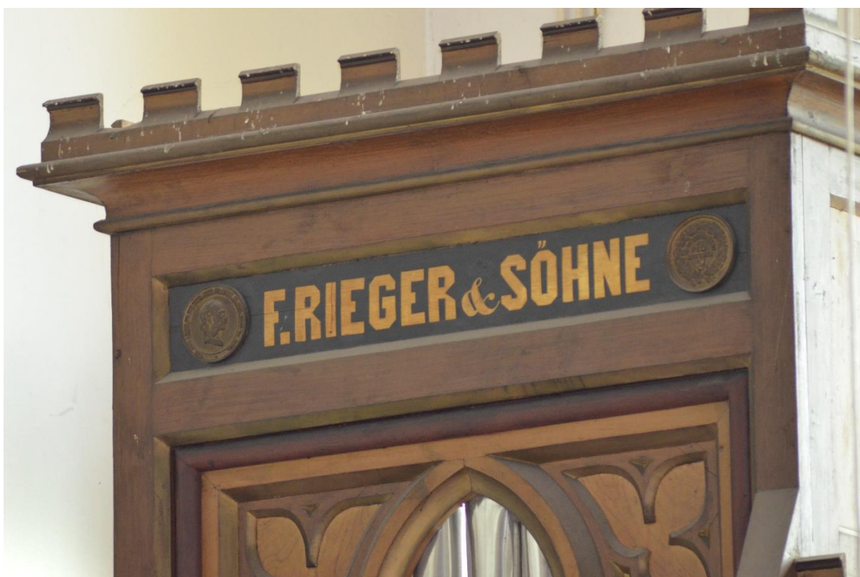
Rapotín, varhany: levá strana varhanní skříně. Detaily znečištění povrchu skříně. Patrné fládrování a zlacení dekorativní prvků (nyní značně znečištěné prachovými depozity případně ptačími exkrementy). Lokálně jsou zřejmé sekundární přemalby zlacení imitací práškovou imitací.