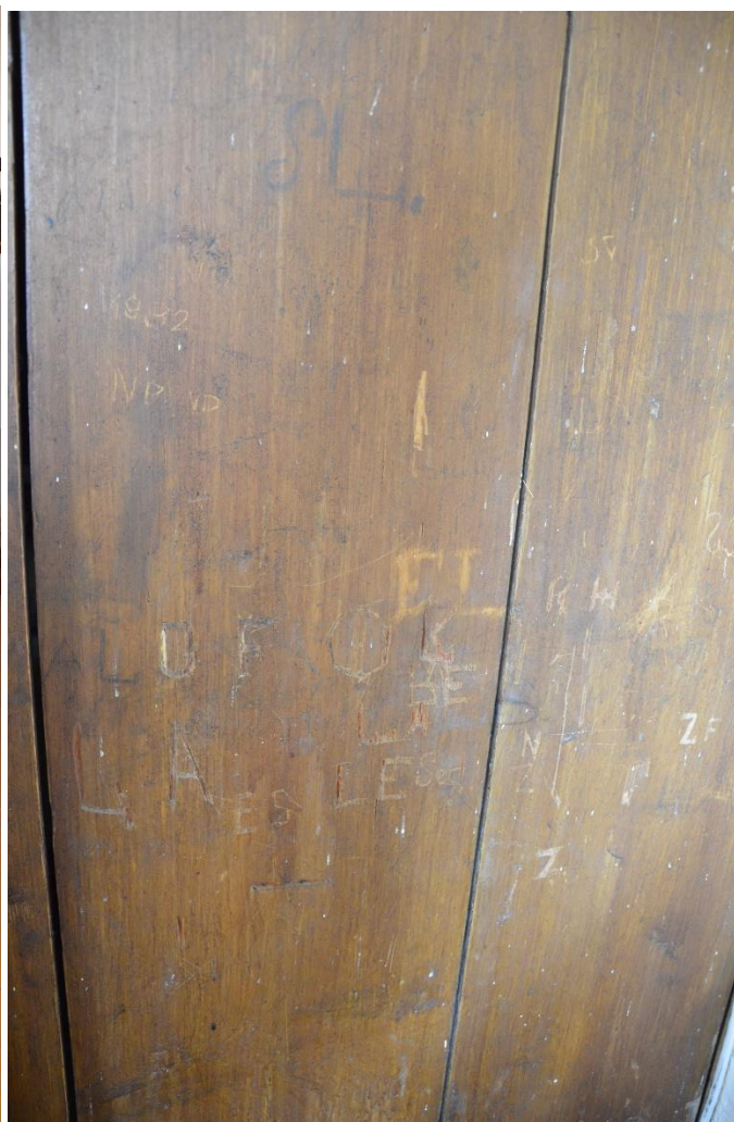
Rapotín, varhany: další pohledy na varhaní skříň ve spodních partiích (četná mechanická poškození graffiti).