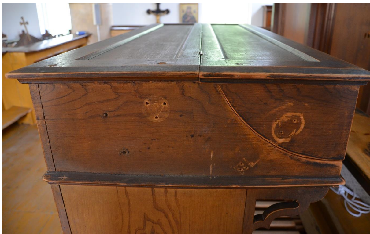
Rapotín, varhany: další detaily varhaní skříně, detail hracího stolu (mechanická poškození).