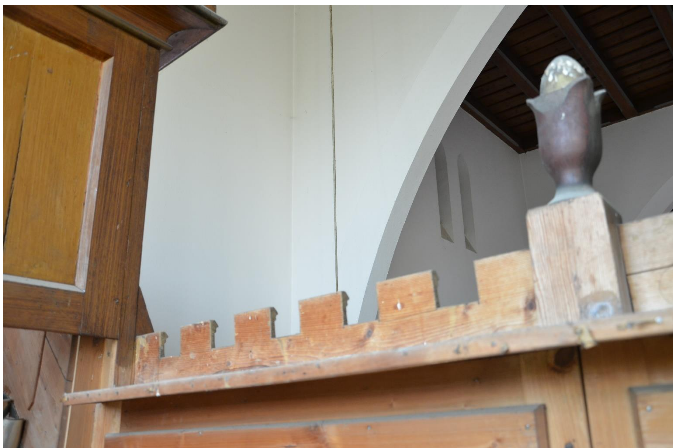
Rapotín, zadní strana cimbuří varhaní skříně.