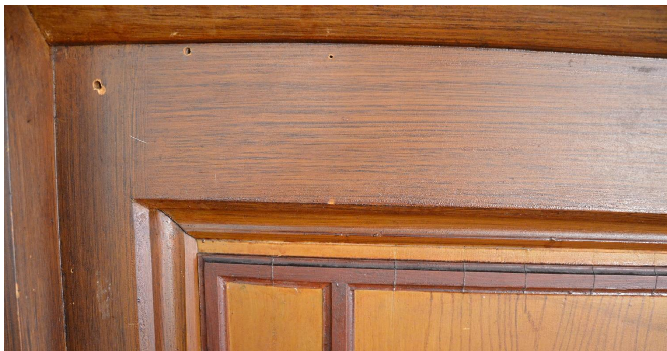
Rapotín, varhany: detaily poškozená a lokální sondy prokazující pod stávající okrovou barvou starší zlacení. V místě rámování přední píšťalové části